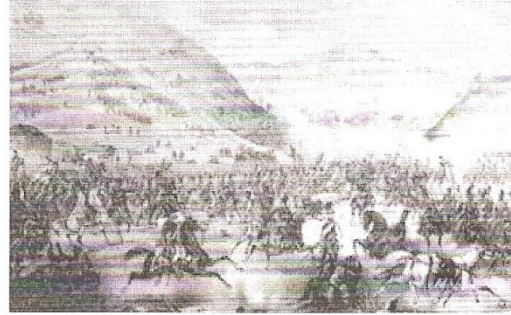
A pákozdi csata