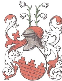
Coats of Arms: Kaas de Mur around 1600