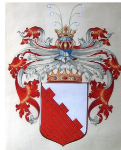
Coats of Arms: Hungarian version 1912